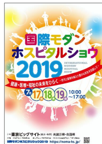
【ポスターイメージ】