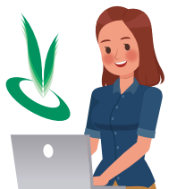
国際モダン ホスピタルショウ 事務局

いままでにない アプリケーション開発した! でも、このアプリだけでは 活用場面が見いだせない。 どこかの製品に搭載することは できないかな…?