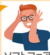
ソフトフェア 開発会社

医療関連メーカー・ディーラーの方々も 多くご来場! 直接PRできる大チャンス!!